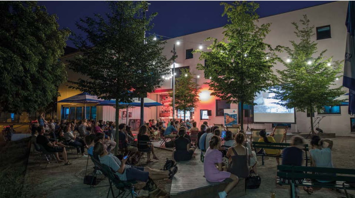
Open Air Kino an der Kulturfabrik in Hoyerswerda