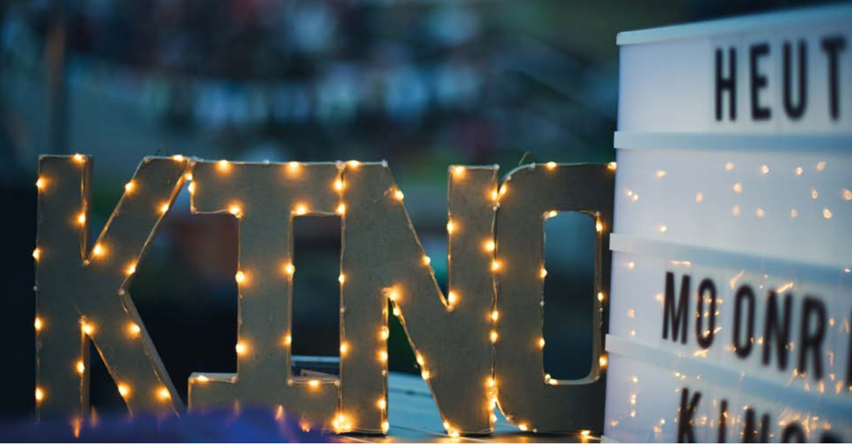
Open Air Kino in Rodewisch

entstehen. Allein an das Filmtheater möchte er die Filmbildung allerdings nicht knüpfen, »da verschenkt man viel« betont er. Und zwar aus ganz pragmatischen Gründen: »An supervielen Orten gibt es einfach kein Kino in der Nähe.« Dann auf Angebote zu verzichten, sei der falsche Weg. »Da müssen kreative Lösungen her«, so der Filmbildungsexperte. »Ohnehin können nur etwa 10 % aller Schülerinnen und Schüler überhaupt ein Angebot wie die SchulKinoWochen nutzen.« Das reiche natürlich nicht aus, auch Eltern und Kinos sieht er hier in der Pflicht. »Man braucht die Möglichkeit, sich auszutauschen, das Gesehene zu reflektieren.« Das hänge aber – wie so oft – auch am Geld.