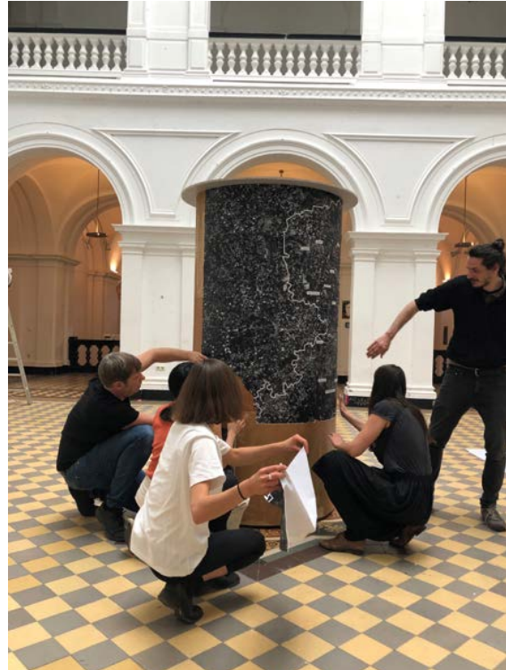
In der Hochschule für Grafik und Buchkunst entsteht die Litfasssäule für „Kino in Bewegung“.

Wir nutzen verschiedene Archive, zum Beispiel die DEFA-Stiftungen. Im Publikum bestehen oftmals Bezüge zum DEFA-Kanon, weil sie