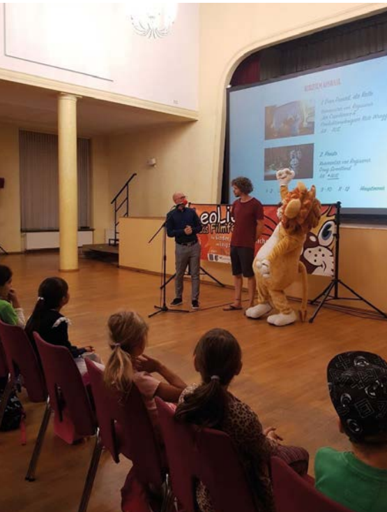
LeoLiese in ihrem Stammhaus dem Filmclub Wurzen

Diese vielfältigen Erfahrungen prägen die Wurzener Kinder nachhaltig und begleiten sie