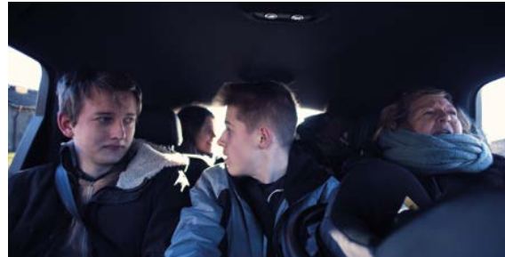
Filmstills aus »Muxmäuschenstil«: Es gibt viel zu tun für Mux.

Die Sommerkino-Tour soll sechs bis acht Wochen quer durchs Land stattfinden. Bis jetzt haben sich bereits 15 Spielstätten dafür gefunden, vor allem im Norden Deutschlands, wo der Produzent Martin Lehwald gut vernetzt ist. Doch alle bundesweiten Kommunen, Ortschaften und Institutionen sind eingeladen, ein Teil der Wanderschaft zu werden und können sich über die Webseite muxfilm.de einfach melden. Das Ganze geht auch noch ganz spontan, denn bis mindestens Ende September soll der Film in Bewegung bleiben und deutschlandweit so viele Menschen wie möglich erreichen, bevor er für die normalen Kinogänger*innen in die Kinos kommt. Ganz im Sinne des italienischen Klassikers »Cinema Paradiso« (Regie: Giuseppe Tornatore, 1988) wird hier also ein anderer Fokus beim Vertrieb gesetzt, der damit auch Schule machen will. Das für den Film gegründete Produktionsstudio Mux Filmproduktion GmbH will damit auch einen Startschuss geben für weitere Filme, die auf diese neue Weise die Menschen unmittelbarer erreichen wollen. Wünschenswert ist diese Ideenumsetzung allemal, denn das Filmschauen außerhalb der eigenen vier Wände sollte für alle möglich sein. Vielleicht kann so zumindest im Kleinen die solidarische Flamme entfacht werden. ■