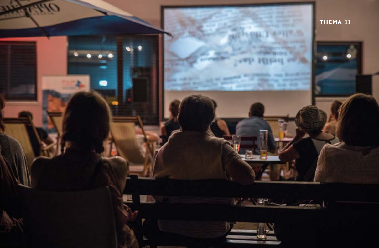
Open Air Kino an der Kulturfabrik in Hoyerswerda

»Mädelsabend« mit Piccolo ein, bietet Weihnachtsfeiern mit Glühwein. Es scheint zu funktionieren, das Union Filmtheater wurde in einer Umfrage des Portals »Testberichte.de« unter Zuschauer*innen zum zweitbeliebtesten Kino in Sachsen, sogar Platz neun unter über 1.000 Kinos in Deutschland gekürt. Da ist Popcorn nicht nur ein Zeichen von Kommerz, worüber so mancher im elitären Großstadt-Programmkinos die Nase rümpft, da ist es auch ein Zeichen für ein gemeinsames Erleben.