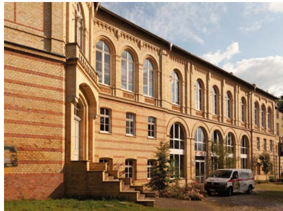
Sitz der Theaterakademie Sachsen ist das Gebäude des ehemaligen Oberen Bahnhofes in Delitzsch.

»Schauspieler ist kein geschützter Beruf in Deutschland«, erklärt Bauke. »Das kann jeder werden und sich auch jeder so nennen. Das macht es schwer, weil der Markt über-