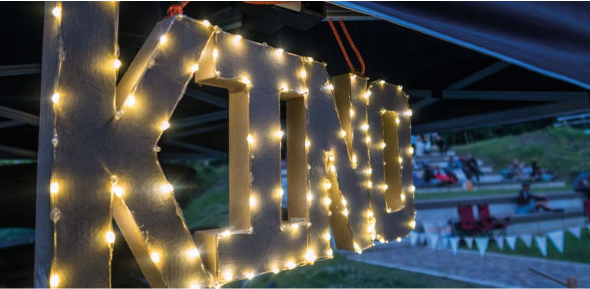
Open Air Kino in Rodewisch